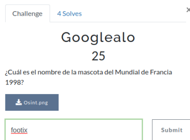
Figura 1. Desafío sobre OSINT

utilizadas para la resolución se pueden encontrar fácilmente realizando búsquedas en Internet en inglés pero no se encuentran tan fácilmente en español. Esta fue la motivación para incorporar ayudas (tanto para facilitar la búsqueda de herramientas como ofrecer materiales explicativos de los temas) favoreciendo una participación más autónoma. Por otro lado, proyectar la tabla de posiciones durante toda la competencia, ofrecer premios al equipo ganador y el acompañamiento por parte de los docentes, favoreció la motivación y el compromiso de los estudiantes.