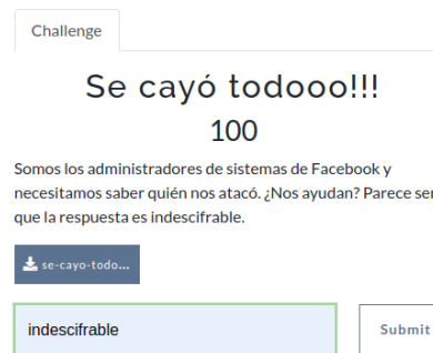
Figura 2. Desafío sobre Ingeniería Social