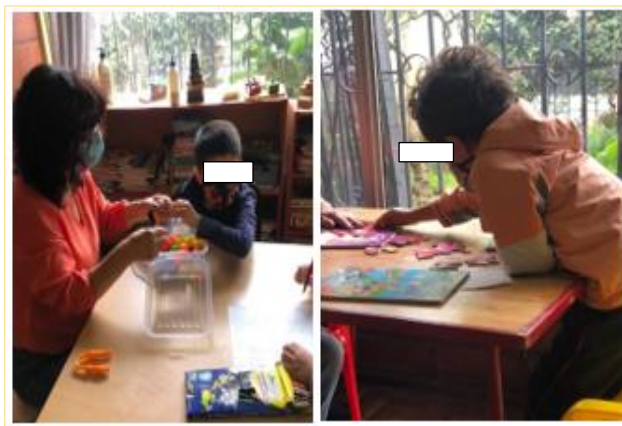
Figura.1. Equipo multidisciplinario trabajando con los niños en la etapa de diagnóstico.

Antes del uso del software: Definimos una línea base diagnóstica de los niños que participaron se utilizó escalas de medición, mediante la aplicación de cuestionarios: Escala de lenguaje preescolar (PLS 5) e Inventario de Desarrollo de Batalle, se calificó los procesos de enseñanza aprendizaje en una escala de 1 al 5, siendo 1 el menor y 5 el mayor para abordar el proceso de intervención de forma individualizada, la idea es marcar los procesos que luego serian abordados, esta evaluación se realiza mediante escalas que buscan identificar el nivel de desempeño del niño en varios aspectos cognitivos que son la base del aprendizaje y del rendimiento escolar. Se evalúan las siguientes habilidades: inteligencia, atención, memoria, en proceso como imitación, motricidad, y coordinación viso motriz.[31]–[33]. En la Figura 1 se muestra a la psicóloga trabajando con niños con TEA.