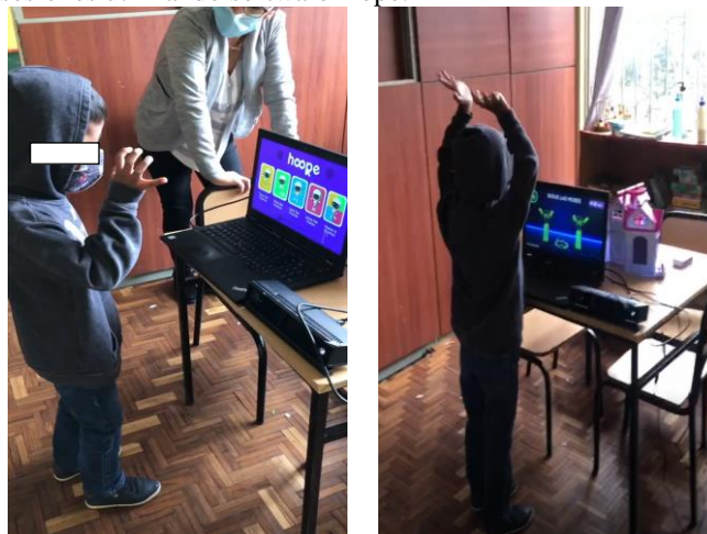
Figura. 4. Niño con TEA sesiones finales trabajo individual mediante el software Hope.

Se definió en el centro de terapia el lugar idóneo para que se efectuó este proceso, un salón donde existe espacio para que el niño se mueva libremente, se definió un campo de acción para que se opere el sistema, el hardware que se utilizó para la puesta en marcha es un televisor, portátil, un Kinect y un soporte. El éxito de las intervenciones mediadas a través de nuevas tecnologías en niños con TEA depende altamente de una planificación precisa, con objetivos claros además de mecanismos de evaluación a continuación se presenta los niños utilizando el software Hope en las sesiones finales donde ya no estaban acompañados de los profesionales. En la Figura 4 se muestra al niño con TEA en las sesiones utilizando software Hope.