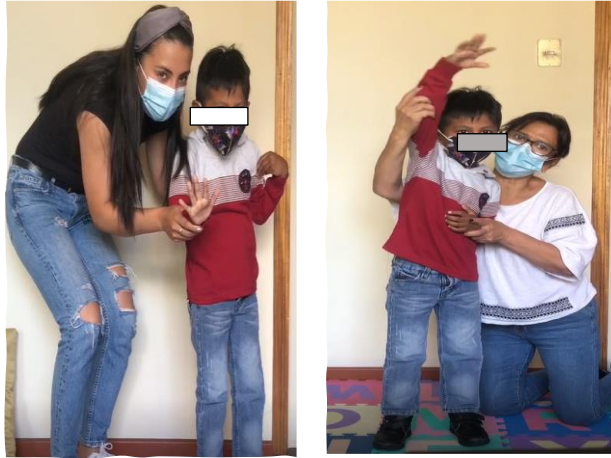
Figura. 3. Equipo de profesionales acompañando al niño con TEA software Hope.

Se definió en el centro de terapia el lugar idóneo para que se efectuó este proceso, un salón donde existe espacio para que el niño se mueva libremente, se definió un campo de acción para que se opere el sistema, el hardware que se utilizó para la puesta en marcha es un televisor, portátil, un Kinect y un soporte. El éxito de las intervenciones mediadas a través de nuevas tecnologías en niños con TEA depende altamente de una planificación precisa, con objetivos claros además de mecanismos de evaluación a continuación se presenta los niños utilizando el software Hope en las sesiones finales donde ya no estaban acompañados de los profesionales. En la Figura 4 se muestra al niño con TEA en las sesiones utilizando software Hope.