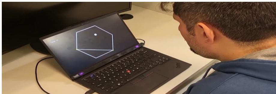
Fig. 2. Jugador esquivando las líneas que van apareciendo dentro del hexágono en Triangle.

Triangle es un videojuego que consiste en esquivar objetos sin enfocarlos directamente. Para hacerlo, el jugador debe utilizar únicamente su visión periférica. La interacción se hace mediante un dispositivo de seguimiento ocular llamado Tobii Eye Tracker 4C. El mismo posee un alto grado de precisión en la detección aún con lentes y barbijo. Esto facilita el control del avatar circular con la vista para no colisionar en forma involuntaria.