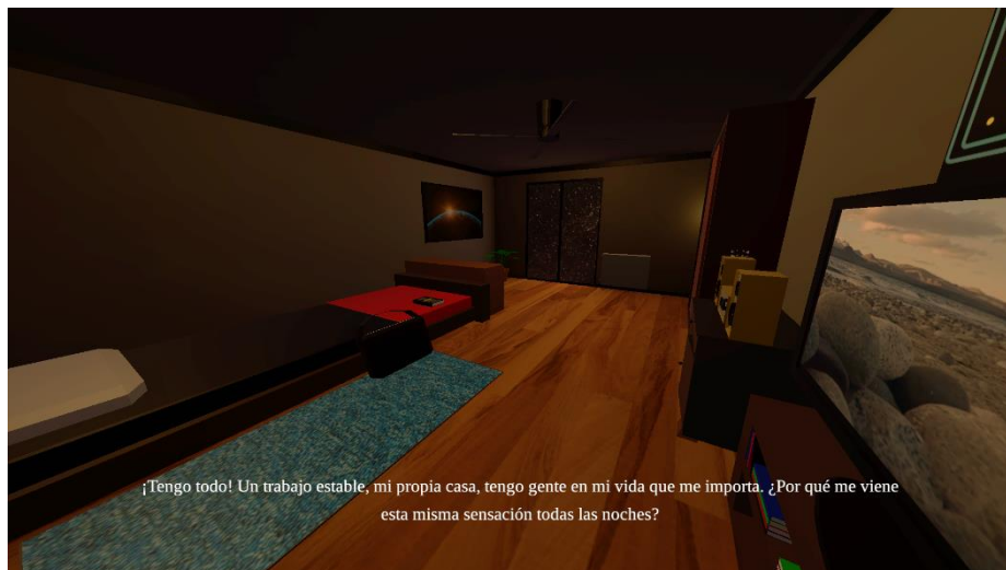
Fig. 3. Captura del videojuego Sensitive Landscapes.

Kermesse XR es un conjunto de minijuegos basados en mecánicas sencillas como repeler, encestar y utilizar la motricidad fina para armar una torre. La interacción se realiza mediante un casco de realidad virtual Oculus Rift CV1 y el Leap Motion, un dispositivo de seguimiento de manos que se adjunta con una pieza impresa en 3D.