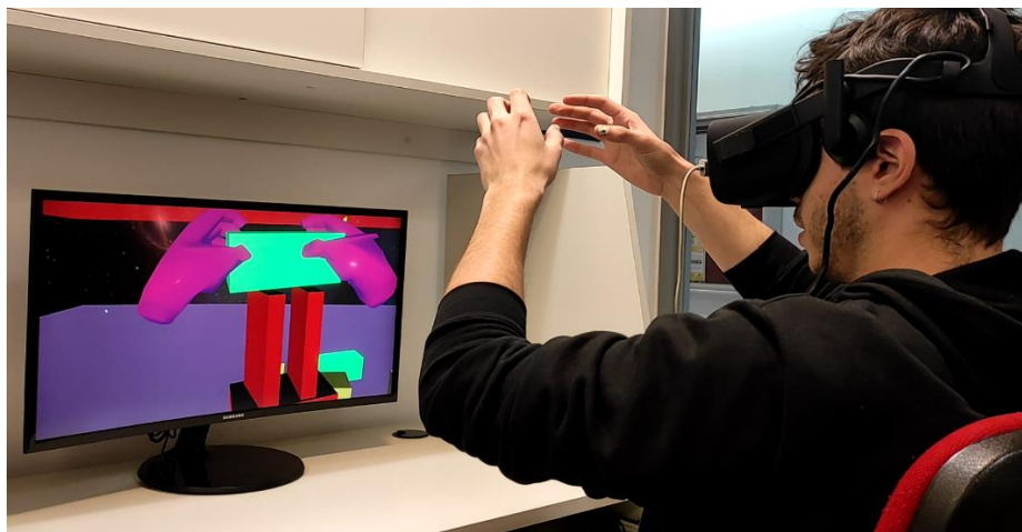
Fig. 4. Jugando a construir una torre con bloques en el videojuego Kermesse XR.

Kermesse XR es un conjunto de minijuegos basados en mecánicas sencillas como repeler, encestar y utilizar la motricidad fina para armar una torre. La interacción se realiza mediante un casco de realidad virtual Oculus Rift CV1 y el Leap Motion, un dispositivo de seguimiento de manos que se adjunta con una pieza impresa en 3D.