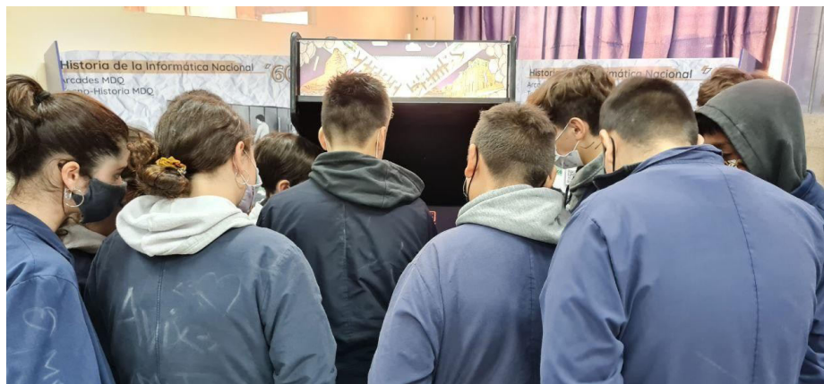
Fig. 7 Registro fotográfico de la Instalación histórica-museográfica durante en la muestra sobre el “Día del Técnico”, organizada por la Escuela de Educación Secundaria Técnica N°3 (EEST N°3) durante los días 17, 18 y 19 de noviembre de 2021. Grupo CITEUS - FH, UNMDP.