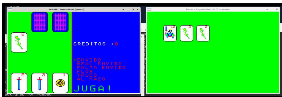
Fig. 4 Imágenes del TrucoTron en MAME y Plugin René. Grupo CITEUS - FH, UNMdP.

La construcción del Arcade MDQ incluyó tanto la ROM de TrucoTron (por ser uno de los pocos juegos de producción nacional) los trabajos que Gustavo venía desarrollando sobre un plugin llamado RENÉ orientado al monitoreo de las ROM que corren en MAME. RENÉ, en homenaje a René Lavand 12 , permite monitorear cuál es la actividad que realiza la reconstrucción de la imagen de la ROM de TrucoTron: se busca que el monitoreo permita identificar y observar (al momento de jugar una partida de truco) cuáles son las decisiones que el juego toma para escoger y repartir las cartas del mazo. En este sentido, el Arcade MDQ busca que quienes accedan a jugar una partida también puedan observar su funcionamiento interno y las decisiones que fueron embebidas a través del código de programación. Estas herramientas tienen una clara motivación analítica y pedagógica. Permiten que la emulación vía MAME – RENÉ favorezca el aprendizaje y la investigación.