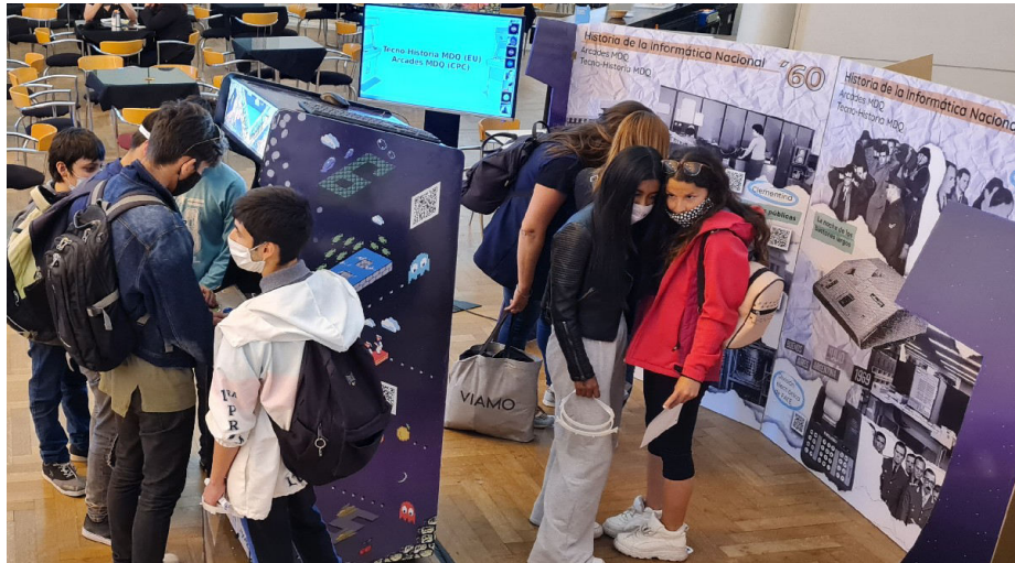
Fig. 6 Registro fotográfico de la Instalación histórica-museográfica en la muestra “La ciencia sale a escena” en el Teatro Auditorium organizada por el programa de Democratización del Conocimiento de la Secretaría de Ciencia y Técnica de la UNMDP durante los días 10 y 11 de noviembre de 2021. Grupo CITEUS - FH, UNMDP.