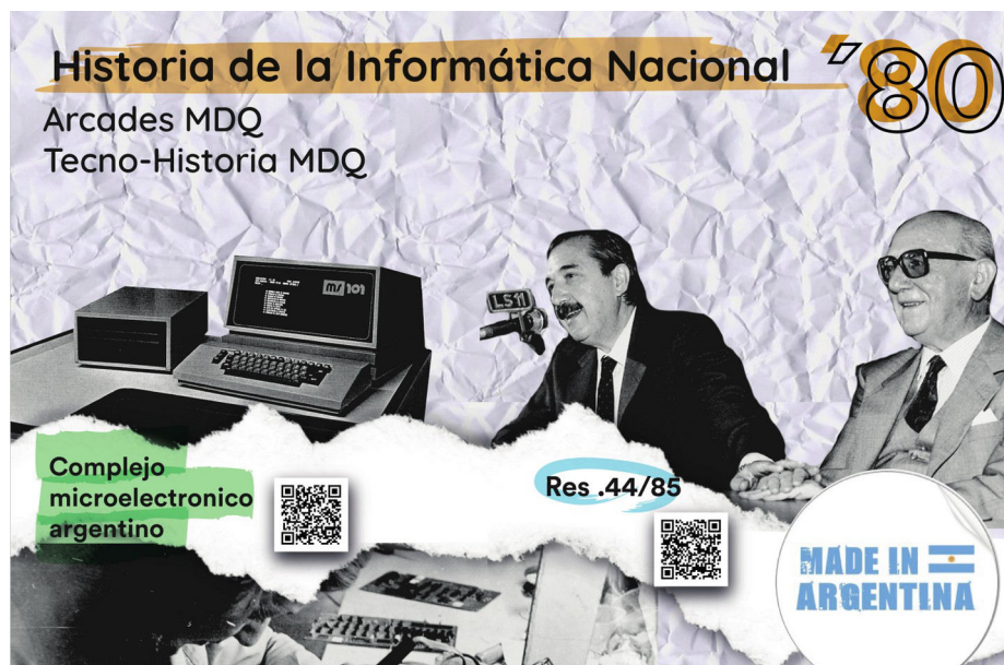
Fig. 5 Extracto de la Instalación histórica-museográfica. Grupo CITEUS - FH, UNMDP.

Se trata de 11 audios que van desde los inicios de la informática académica en la República Argentina hasta la importancia de los videojuegos arcade en las décadas del '80 y '90 en la ciudad de Mar del Plata (CEFIBA, Clementina, Universidades Públicas Nacionales, CEUNS, SADIO, CUPED, División Electrónica de FATE, Microsistemas, Complejo Electrónico Argentino, SACOA, Trucotron). Estos elementos se organizaron en un relato histórico interactivo sobre la informática que incluyó imágenes, artefactos, y producción audiovisual con contenido histórico-educativo sobre la temática disponible al público a través de la instalación. Los contenidos problematizan procesos, instituciones y actores sociales relevantes de la historia de la informática nacional como las Universidades Públicas y su centralidad en la informática académica -que incluye la construcción de prototipos-, la alianza entre el Estado y las corporaciones tecnológicas informáticas internacionales, las políticas públicas de promoción de la industria nacional del sector, entre otras. A su vez, se ha visibilizado el rol de las mujeres tanto en la investigación académica como en la producción fabril del sector.