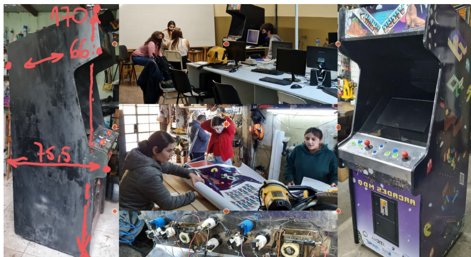
Fig. 1 Composición realizada en base al registro fotográfico de las actividades de los proyectos Tecno-Historia MDQ y Arcades MDQ. Grupo CITEUS - FH, UNMDP.

Luego de conseguir la carcasa externa comenzó otra parte del trabajo colectivo. Fueron varias tardes de ajuste externos (lija, masilla y pintura), de rediseño y adecuación interna y de la detallada colocación de los plotteos que lo volvieron una pieza de atracción para las miradas jóvenes y no tan jóvenes que visitaron las muestras. Al respecto, el arcade también fue ensamblándose con piezas recuperadas de cajones, desvanes, oscuros baúles o de galpones donde esperaban mejor destino. De las reuniones y llamados por teléfono aparecieron el teclado y el mouse, al igual que un motherboard y microprocesador que estaban sin uso. De igual forma llegó un viejísimo monitor (con más de 20 años de uso) que todavía funcionaba y compramos un disco sólido para terminar de armar la computadora. Esta revalorización de las diferentes piezas de la computadora se completó con la instalación del sistema operativo libre GNU/Linux Ubuntu y con el emulador MAME (ver próxima sección).