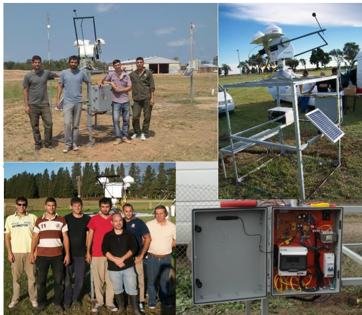
Fig. 6. Estaciones solarimétricas y grupo de trabajo INTA

Los niveles de radiación solar global sobre la superficie terrestre constituyen información importante, ya sea para dimensionar sistemas de aprovechamiento energético de la radiación solar, para estimar el rendimiento de cosechas o como parámetro de interés biológico. También es de destacar su relevancia en el análisis meteorológico, ya que las variaciones en los niveles de energía solar pueden estar relacionadas con cambios climáticos. Progresivamente se van ampliando los campos en que dicha información puede aplicarse, debido al desarrollo tecnológico o a los avances en la investigación de la interacción de la radiación con seres vivos o con la atmósfera.