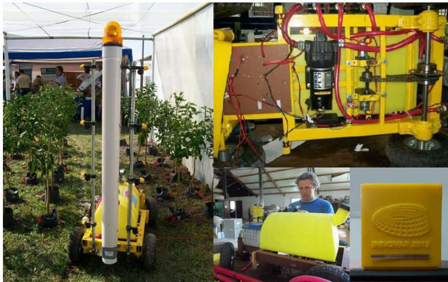
Fig. 2. Robot TRAKÜR

El Instituto de Ingeniería Rural ha desarrollado el robot TRAKÜR (figura 2), un prototipo que consiste en una plataforma autónoma autoguiada para el control de plagas en cultivos bajo cubierta que cuenta con un sistema de pulverización completo y autonomía suficiente para cumplir una jornada de trabajo. Una tecnología autónoma es aquella que puede tomar decisiones más o menos simples sin la intervención humana. Este desarrollo promueve la salud del operario durante el proceso de aplicación de fitosanitarios, disminuyendo su exposición a los productos en espacios confinados y aplicando eficientemente productos en bajas dosis.