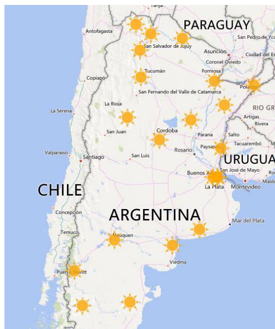
Fig. 8. Ubicación de las estaciones solarimétricas instaladas en la actualidad

Este proyecto, financiado por Fondo de Innovación Tecnológica Sectorial de Energía (FONARSEC-MINCYT), orienta sus tareas a centralizar la información, depurando y procesando datos generados en sitios diversos de nuestro país, analizando su representatividad espacio-temporal y crear una red centralizada con control de la información, permitiendo que la representatividad de los datos colectados sea mucho mayor que la que pueden brindar redes aisladas no centralizadas.