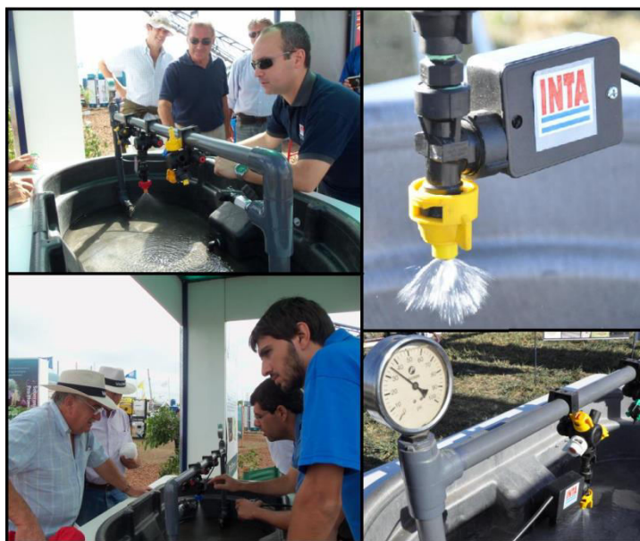
Fig. 4. Sistema de dosis variable PWM INTA

En lo concerniente a dispositivos para realizar dosis variable en pulverización existen el mercado diversos sistemas que trabajan con diferentes técnicas. El dispositivo denominado PWM (Pulse Width Modulation) o en español, Modulación por Ancho de Pulsos, representa una solución promisoría debido a que permite regular el caudal sin modificar la presión de trabajo ni cambiar la pastilla en cuestión.