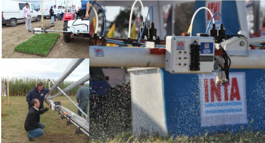
Fig. 3. Detector de Malezas

En la actualidad, los herbicidas son aplicados uniformemente en la totalidad de la superficie del lote, siendo esto innecesario debido a que las malezas pueden ocupar desde el 80% hasta el porcentaje casi ínfimo de la superficie tratada. Una pulverización selectiva mejoraría notablemente la eficiencia en el uso de agroquímicos, disminuyendo los riesgos de ocasionar daños a la salud humana y al ambiente.