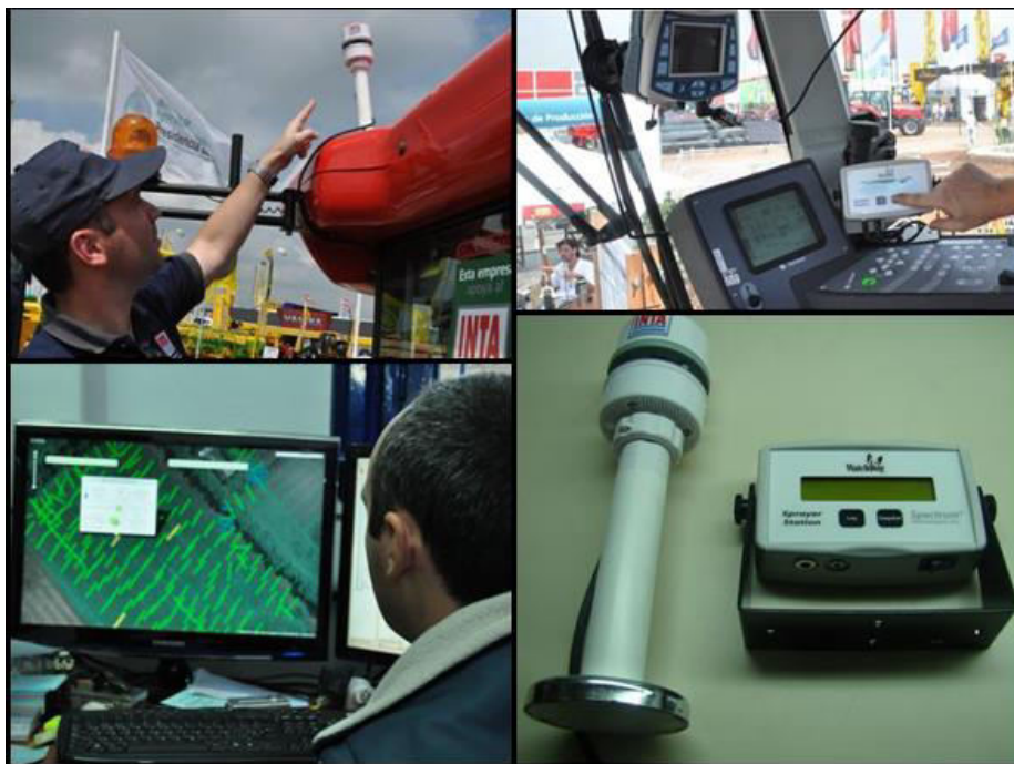
Fig. 5. Sistema de monitoreo climático y deriva en aplicaciones

El tercer desarrollo vinculado con la aplicación eficiente de agroquímicos es el sistema de monitoreo climático y deriva en aplicaciones periurbanas de agroquímicos (figura 5).